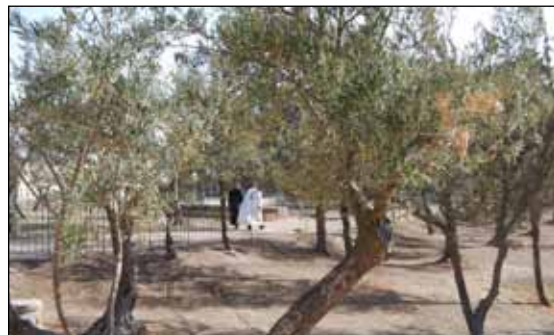
Le jardin sera ouvert du lundi au samedi de 08h00 à 12h00 et de 14h00 à 17h00. Il sera fermé les dimanches et le jour de Noël