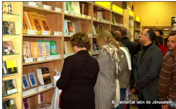
La nouvelle librairie « Iesua al Malik » à Beit Sahour