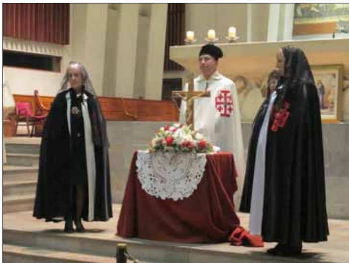
Mgr Shomali a emporté avec lui à Montréal une relique de la Sainte Croix

Dimanche 6 novembre, l'Ordre Equestre du Saint Sépulcre de Jérusalem avait invité Monseigneur Shomali, évêque auxiliaire pour Jérusalem à célébrer avec Mgr Louis Dicaire, grand prieur de l'Ordre du Saint Sépulcre (Lieutenance de Montréal) une messe solennelle à Montréal en l'honneur de Notre-Dame de Palestine. Une relique de la Vraie Croix fut vénérée avec dévotion par 900 fidèles. La messe solennelle fut célébrée à 15h à l'Oratoire Saint-Joseph du Mont-Royal à Montréal (Québec). C'est le Chœur Melkite qui a conduit les chants de la célébration.