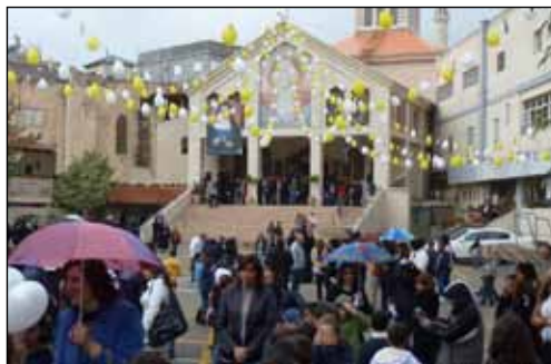
La Bienheureuse a en outre été fêtée à Bethléem, et à Fuheis en Jordanie