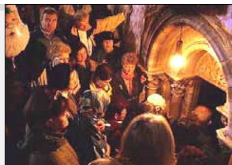
Le divin Enfant attend tous les ans les nouveaux bergers que sont les pèlerins

Un objectif qui fait écho aux initiatives qui ne manquent pas notamment en matière d'entretien des Lieux Saints et d'accueil des pèlerins pour les aider à prier. Dernièrement encore, le 15 novembre, a eu lieu l'inauguration